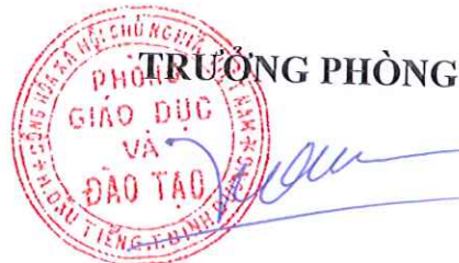
Tạ Tấn Tuấn